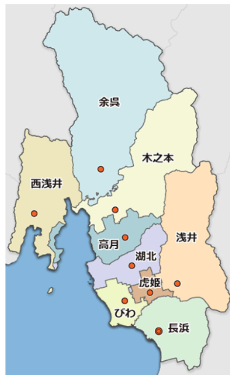
旧市町地域の図書館および図書室の位置

令和元年(2019年)度の実績は、市全体で約99万冊の蔵書を所有し、登録者は約5万2千人、移転に伴う長浜図書館の臨時休館や新型コロナウイルス感染拡大防止のための臨時休館がありました。実利用者数は約1万4千人、個人貸出は約87万4千冊等となっています。